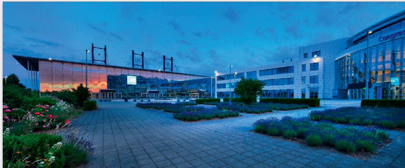
CongressCenter Erfurt